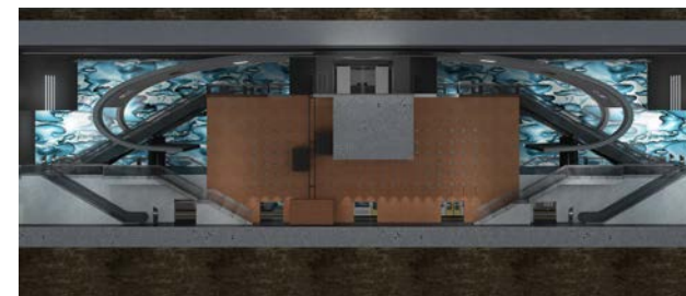
Stazione di San Pasquale della Linea 6